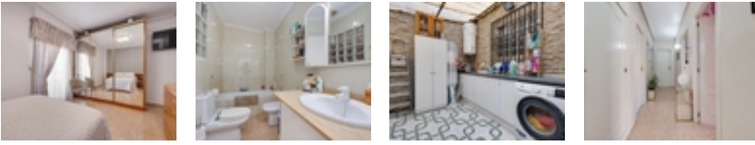
Amplia vivienda céntrica con solárium privado en Torrevieja