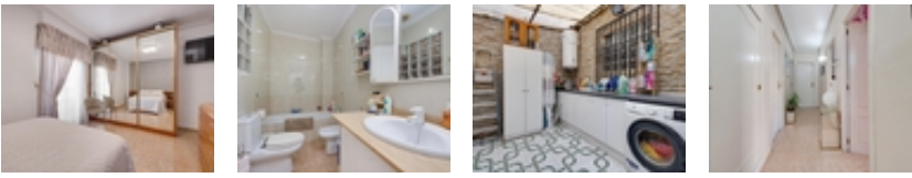
Amplia vivienda céntrica con solárium privado en Torrevieja